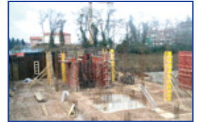
Come si presenta oggi il cantiere del nuovo Centro di Ricerca Clinica sul Cancro