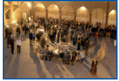
Il cortile del Castello di Bentivoglio