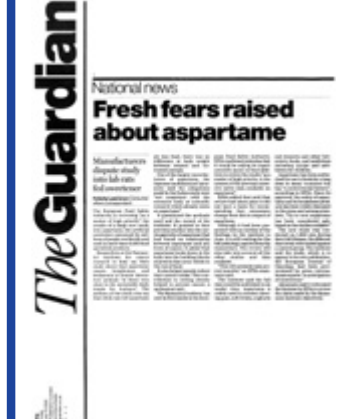
The Guardian 30/9/2005