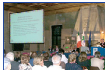
Due momenti dell'assemblea soci tenutasi al Castello di Bentivoglio