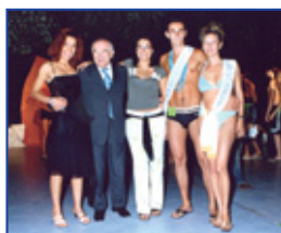
Sezione soci di Castello di Serravalle