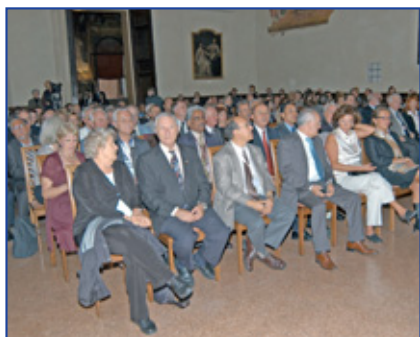
Congressisti durante la Cerimonia inaugurale