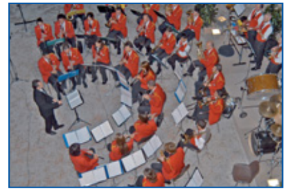
La banda di Minerbio