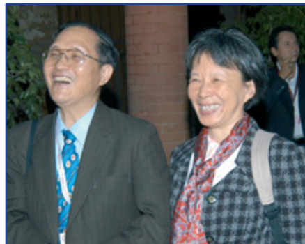
I Dottori Jung-Der Wang (Cina)

Alla conferenza hanno partecipato oltre 250 scienziati, provenienti da 35 paesi dei cinque continenti, in particolare dall'Europa (105), dal Nord America (85), dall'Asia (16). Sono state presentate oltre 100 relazioni e gli atti verranno pubblicati negli Annali dell'Accademia delle Scienze di New York.