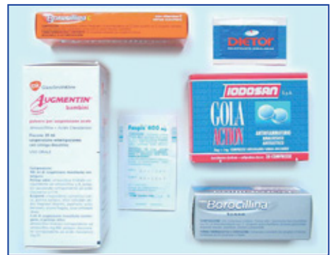
Medicinali contenenti aspartame