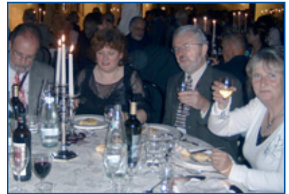
Partecipanti durante la cena di gala