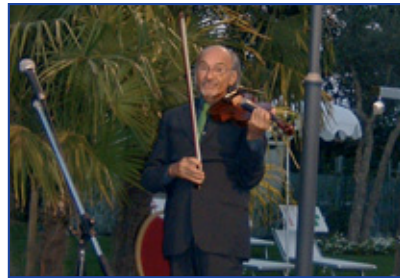
Maestro Piergiorgio Farina