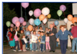
Festa d'estate della sezione soci di Quinzano - Loiano