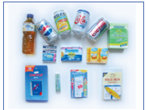
Prodotti contenenti aspartame