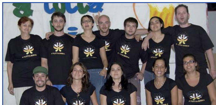
Festa "a tutta birra"

L'idea di questa festa nasce dal desiderio di un gruppo di amici che conoscevano le attività dell'Istituto Ramazzini di divulgare e promuovere tali conoscenze ai "giovani". Abbiamo quindi unito le proposte dando vita a "a tutta birra" cinque giorni di musica, divertimento, ottima birra e prelibato mangiare (il taffio). Ogni anno cerchiamo di trovare nuove idee che possano rendere la nostra festa indimenticabile quindi non vi resta che aspettare la prossima estate e venirci a trovare, unendo così l'utilità nel fare beneficenza e il dilettevole nel passare una serata all'insegna del divertimento. "Vi aspettiamo!"