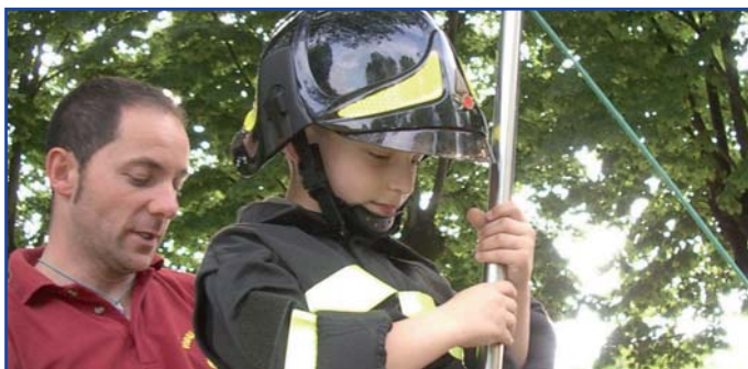
Dimostrazione dei Vigili del Fuoco di San Pietro in Casale durante Castello in Festa 2008