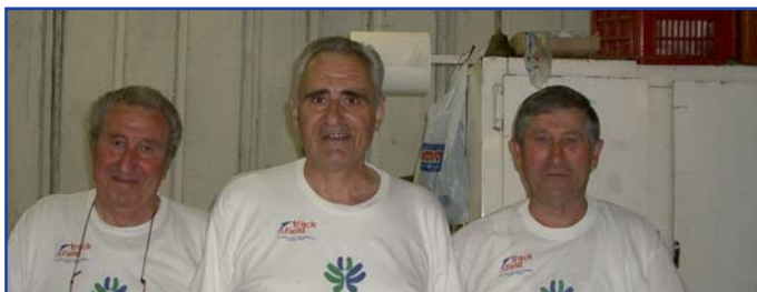
Soci in servizio allo stand gastronomico