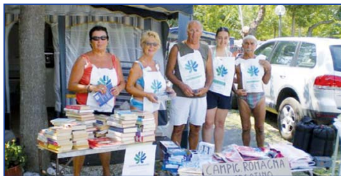
Mercatino di beneficenza Campeggio Romagna