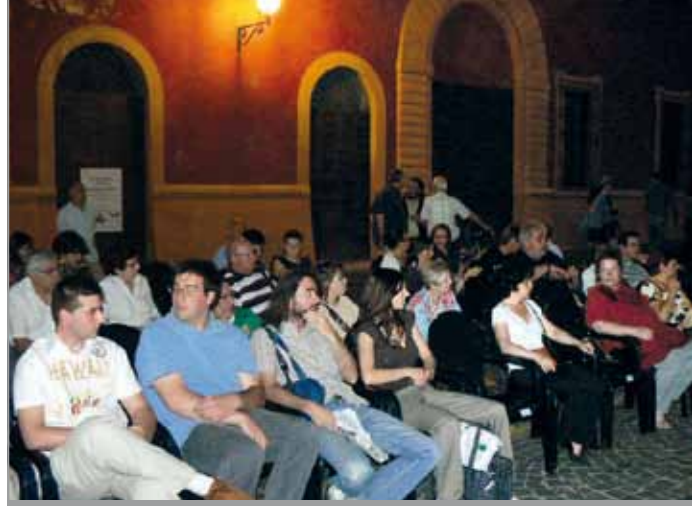
Il pubblico di Piazza Mazzini

È noto che i pannelli truciolari sono costituiti da particelle legnose agglomerate da un collante di resine sintetiche e successivamente pressate, che nel tempo esalano formaldeide. Il tipo di odore pungente della formaldeide è come quello che si avverte soprattutto