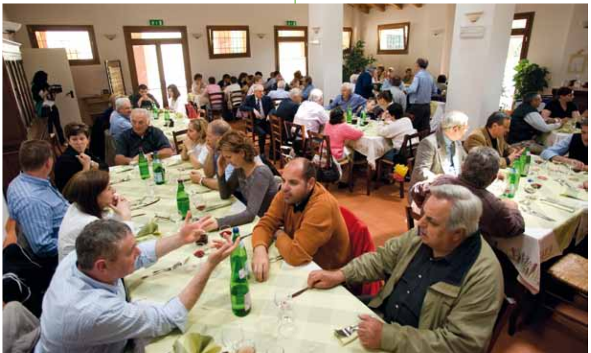
Il pranzo sociale presso il ristorante dell'agriturismo Oasi La Rizza

Alle difficoltà rispondiamo con una rinnovata e diretta assunzione di responsabilità. Non vogliamo disperdere esperienze ed organizzazione costruite in decenni di lavoro, non intendiamo abbandonare ad un incerto destino medici e biologi impegnati nella prevenzione del grande male del nostro tempo: il cancro.