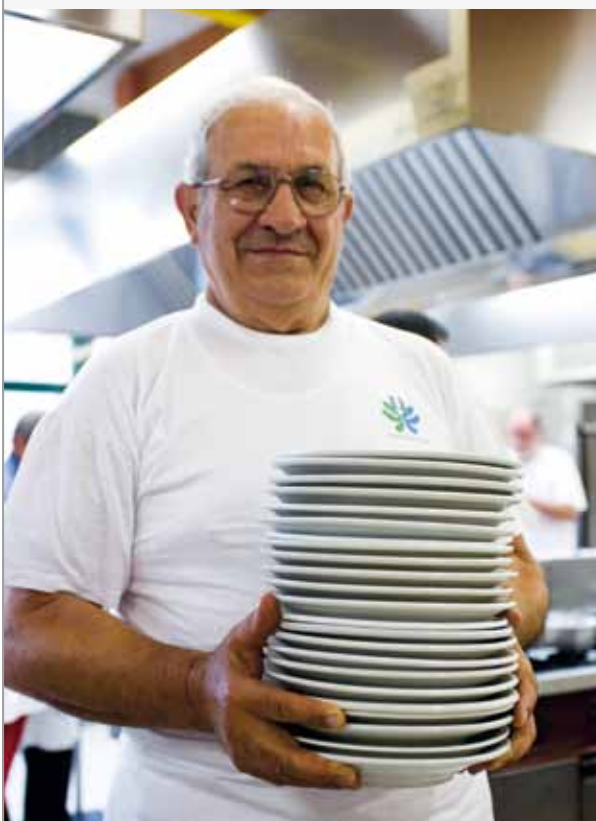
Un volontario della sezione Bologna Pianura a "Castello in festa"

solo nella parte nord ovest della città: una a Corticella e Navile e l'altra a Borgo Panigale e Reno.