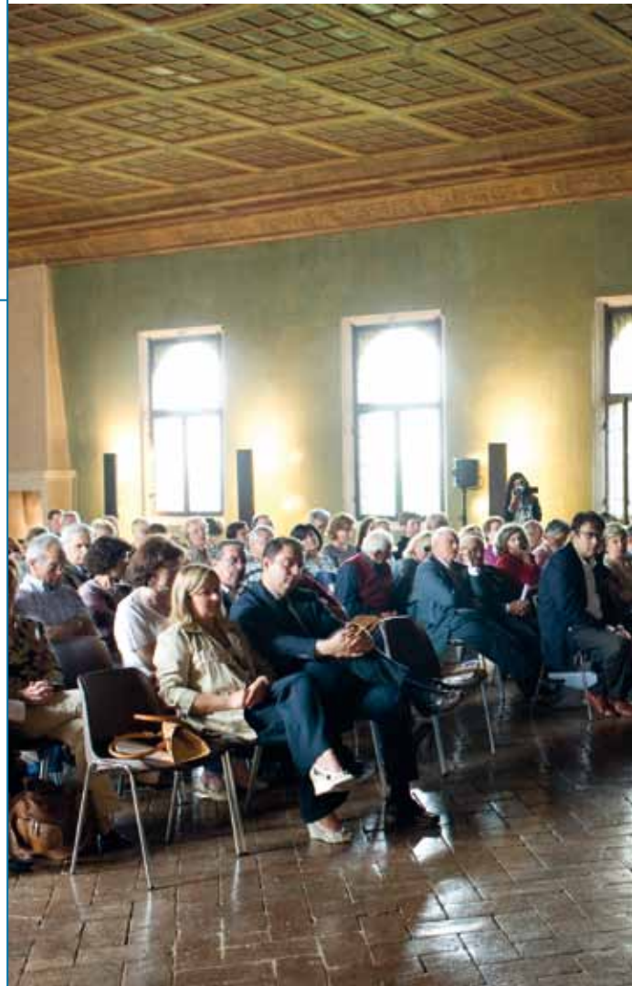
La relazione scientifica all'Assemblea dei Soci del 14 Maggio 2009

Un corretto programma di prevenzione deve prevedere l'esecuzione periodica del dosaggio del PSA, della visita urologica ed eventualmente