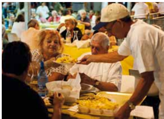
Il servizio ai tavoli

Più di 150 soci volontari sono stati impegnati ogni sera, per 13 giorni consecutivi, oltre al ristorante anche al bar, al mercatino, alla lotteria, allo stand istituzio-