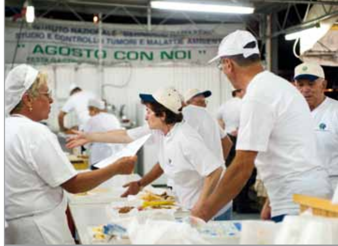
Volontari in cucina

nale, che ha proposto, in anteprima, un nuovo video promozionale sull'Istituto. Tutto questo è un segno di organizzazione, di prezioso, meticoloso lavoro protrattosi per mesi.