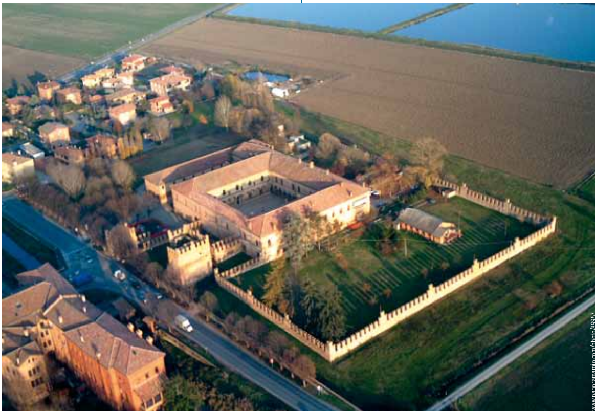
Una veduta aerea del Castello di Bentivoglio, sede del Centro di Ricerca sul Cancro "Cesare Maltoni" e del nuovo Centro di Saggio Europa

del dicembre scorso, sono state attivate tutte le procedure relative alla certificazione ministeriale per la sperimentazione secondo le BPL, cioè l'applicazione delle linee guida OCSE che riguardano struttura ed organizzazione, conduzione delle ricerche, gestione e rintracciabilità dei dati prodotti. Tale certificazione rappresenta il titolo più qualificato richiesto a livello internazionale per la registrazione dei prodotti commerciali. All'interno del Castello è stato identificato uno spazio dedicato alle BPL in cui verranno svolte le ricerche a contratto; lo spazio è stato denominato Centro di Saggio Europa (CDSEU). Le prospettive di sviluppo di questa nuova attività certificata BPL sono davvero importanti ed i primi commenti sulla nostra possibile partecipazione al programma REACH sono lusinghieri. Auspichiamo che questa attività, altamente qualificata per le ricadute internazionali, commerciali e normative, comporti un salto di qualità del nostro Centro per quanto riguarda la capacità di auto-finanziarsi. Certo è che non dovrà mancare l'appoggio dei nostri Soci per mantenere salda la nostra prerogativa: quella del perseguimento della verità. •