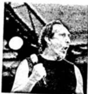
Tutti gli artisti si esibiscono gratis