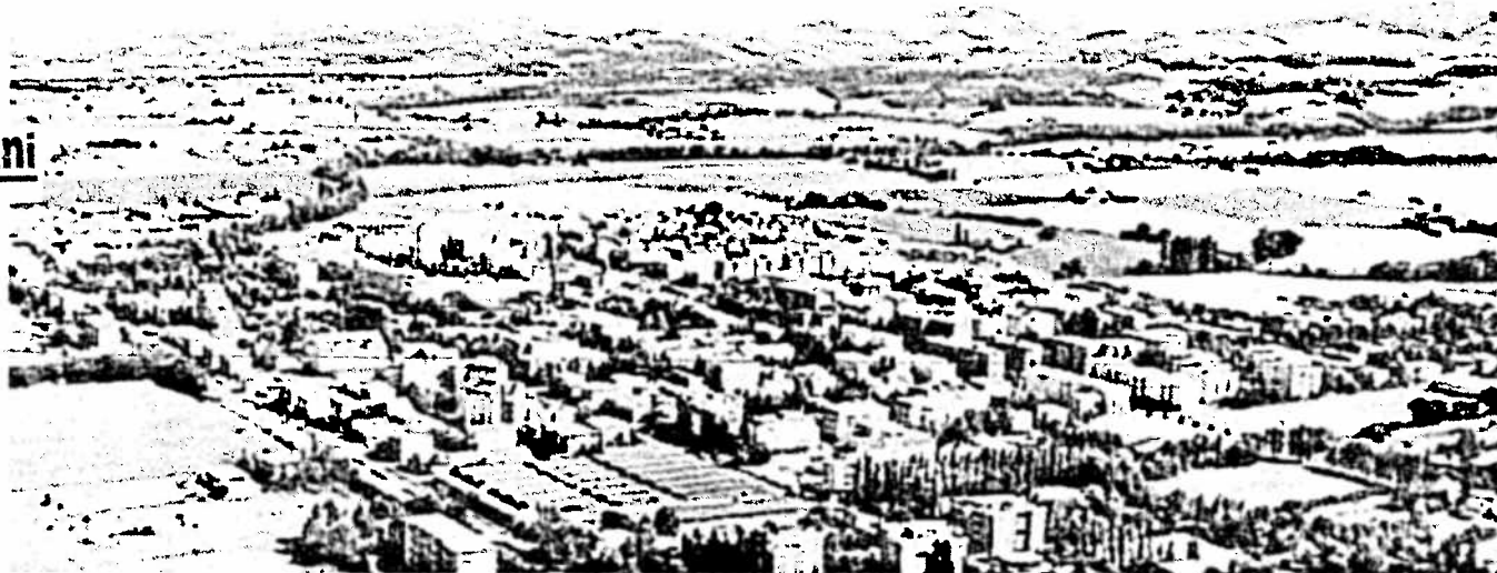
I cittadini di Ozzano La popolazione residente ha superato quota 13.000